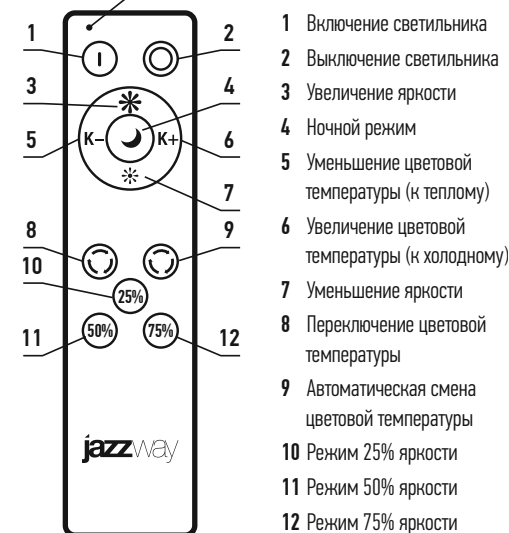
Световой индикатор включения